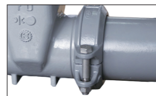
フランジレスのジョイント形です。