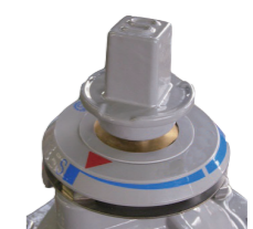
埋設配管用開度計付