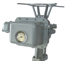
電動弁付外ねじ式