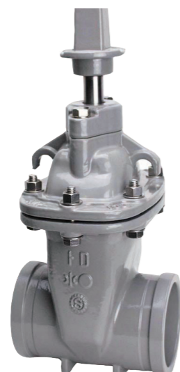
ショルダージョイント形

ステンレス製キャップ、ロング形、ハンドル車式、埋設配管用開度計付、露出配管用開度計付、中間ロッド、電動外ねじ式