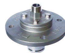
排水用ニップル付タイプ (R1)