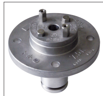
カバーを取り外した状態