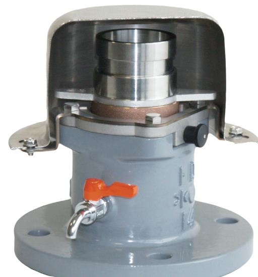
口金内蔵型(カット見本)