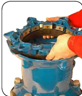
6. ブラケット一式取付