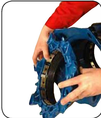
3. ブラケット一式取り外し