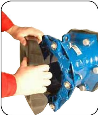
1. 保護キャップ取り外し