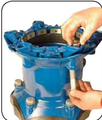
7. ボルトナット取付