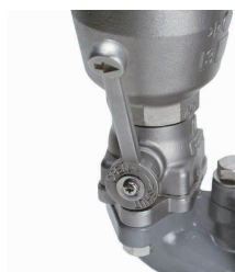
空気弁用コック (ロングレバー)