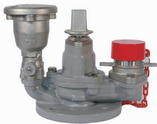
急速空気弁付 (コック有)