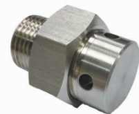
ステンレス製水抜き栓 (凍結防止用)

※このカタログ内に掲載されている写真・図面(番号)は製品の一例を示すものです 製品の寸法・仕様等はあらかじめ予告なしに変更することがありますのでご了承ください