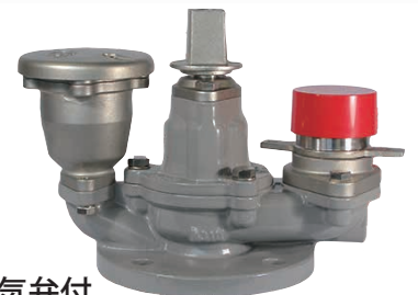
急速空気弁付 (コック無し)