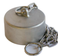
ステンレス製口金ふた