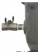
オプション：圧力解放弁

※このカタログ内に掲載されている写真・図面(番号)は製品の一例を示すものです 製品の寸法・仕様等はあらかじめ予告なしに変更することがありますのでご了承ください