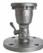
エアライト空気弁φ25