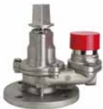
サスキャメル消火栓