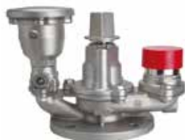
急速空気弁付サスキャメル消火栓