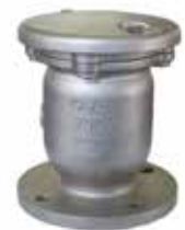
エアライト空気弁φ75

※このカタログ内に掲載されている写真・図面(番号)は製品の一例を示すもので 製品の寸法・仕様等はあらかじめ予告なしに変更することがありますのでご了承ください